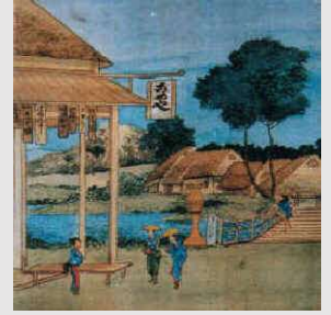
江漢の描いたとされる戸塚宿の浮世絵

広重の保永堂版の浮世絵が世に出る（天保4年：1833）数十年前に、司馬江漢なる人物がいたとされます。絵師で蘭学者、多彩な才能の持ち主であったと伝わります。この人物こそは、東海道五十三次のタネ絵を描いたのではとされています。戸塚宿の絵に限らず、お隣の保土ヶ谷宿他、多くの広重の浮世絵と類似しています。江漢の戸塚宿の絵を見ると、馬の旅人こそいませんが、基本的な構図はほぼそっくりで、こめ屋・講札・道標などもそのままに見えます。果たして広重は、本当に戸塚の宿場を見たのか、それともパクッタのか・・・? 気をもむところですが謎です 戸塚見知楽会