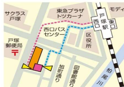
※駐車場・駐輪場はありません

利用時間：10時~16時（平日のカフェは11時~15時30分） 休館日：祝日、年末・年始、夏休みなど 〒244-0003 横浜市戸塚区戸塚町 4018-1 ザ・パークハウス戸塚フロント 1階 TEL&FAX：045-865-4670 URL https://yume-hiroba.net/ E-mail koryuhirobatotsuka@gmail.com 〈運営団体〉NPO法人くみんネットワークとつか